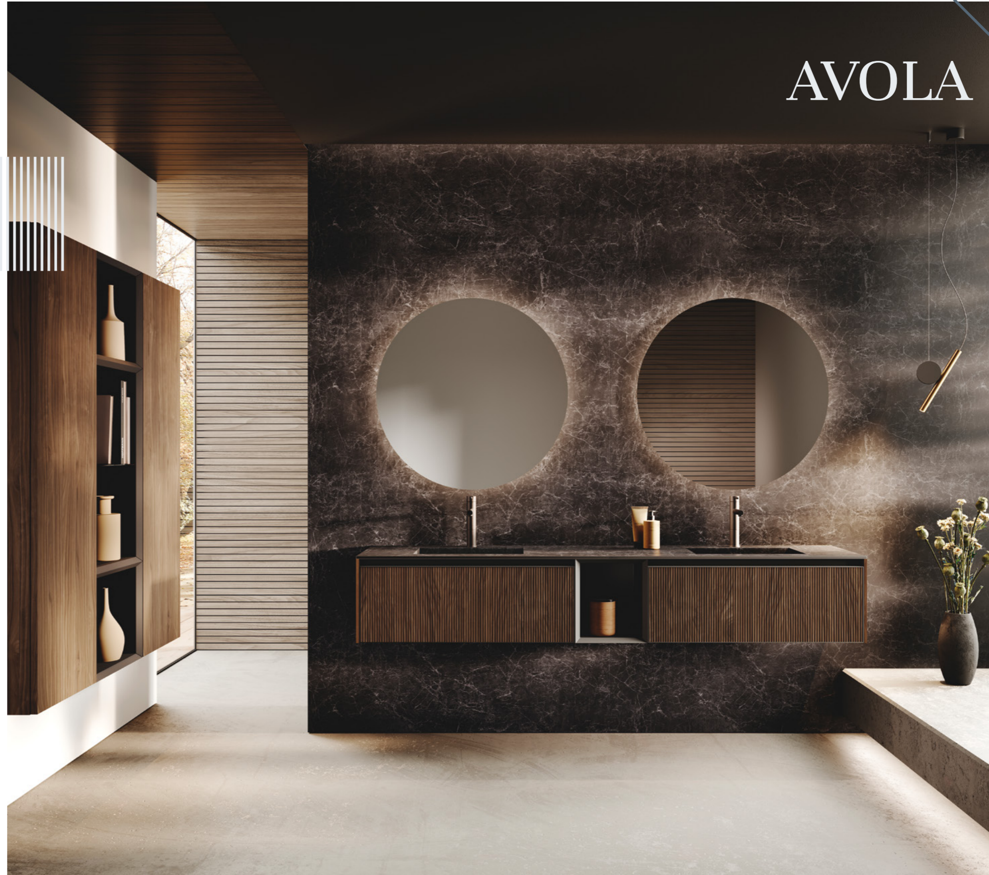
Avola legno rigato Noce canaletto telaio alluminio nero. Piano Gres Nero greco opaco. Modulo Folding Nero onice

We let materials get over their own attitude. it implies the ability to become a real tool of nature to enhance the range of possibilities of elements like the native mildness of wood or the suggestions coming from the space.